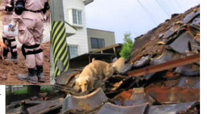
新潟地震で搜索する小型犬

更に災害に備えて平時から国、自治体、NPOなどの協働は不可欠であり、当協会は八都県市合同防災訓練や久喜市、蓮田市など多数の合同訓練に積極的に参加し、連携を取っています。