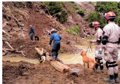
岩手・宮城内陸地震で搜索活動にあたる救助犬たち

平成20年6月に起きた岩手・宮城内陸地震では被災地の救援対策本部の指揮のもと、現地に入り2日間にわたり搜索活動を懸命に行いました。現場では電話や無線機が不通のため衛星電話等の通信手段の確保、特に自治体との事前の出動協定の締結の必要性を痛感しました。このことが、今後搜索活動を迅速にする重要なキーポイントになります。